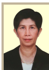
กรรมการอิสระ และกรรมการตรวจสอบ Independent Director and Audit Committee