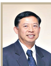
ประธานกรรมการตรวจสอบ และกรรมการอิสระ President of Audit Committee and Independent Director