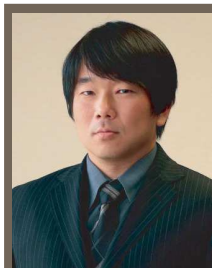
ประธานกรรมการ Chairman of the Board