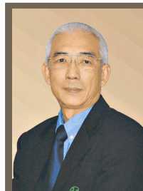
รองประธานกรรมการ Vice Chairman of the Board